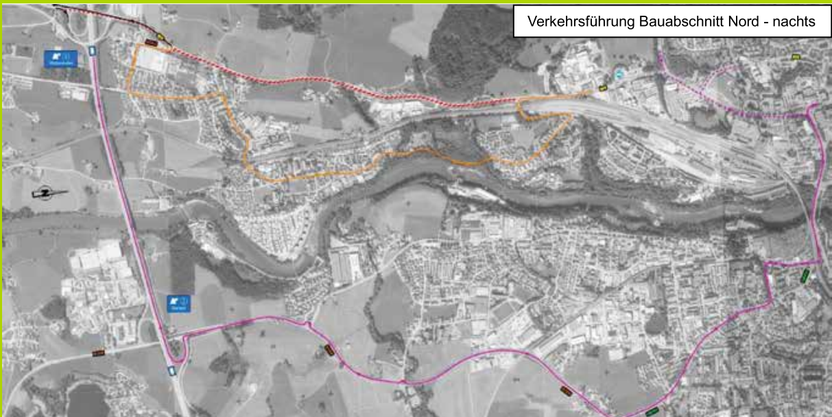
Verkehrsführung Bauabschnitt Nord - nachts

straße / Nestlestraße / Georg-Haindl-Straße / Heggener Straße / Obere-Eicher-Straße. Schwerverkehr ab 12 Tonnen wird über die Anschlussstelle Durach umgeleitet.