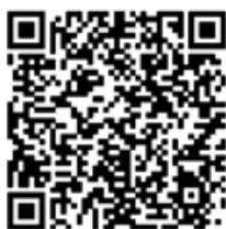
QR-Code zu Instagram

Großes Interesse gab es auch beim Thema Zukunftsbäume. Hier erfuhren die Teilnehmerinnen, warum einzelne Bäume gezielt gefördert werden, damit sie genügend Licht und Platz zum Wachsen bekommen. Eine kurze Vorführung zeigte zudem, wie eine sichere Baumfällung durchgeführt wird.