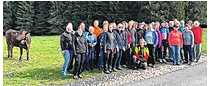
Die Teilnehmerinnen des Frauenwaldbegangs

Wer Unterstützung bei Fragen rund um den Privatwald, Waldumbau oder Pflege benötigt, kann sich an das AELF Kempten, die Waldbesitzervereinigung Kempten oder die Forstbetriebsgemeinschaft Oberallgäu wenden.