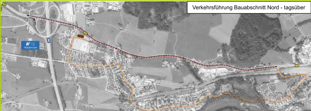
Verkehrsführung Bauabschnitt Nord - tagsüber

Der aus Süden kommende B19-Verkehr wird bereits an der Anschlussstelle Waltenhofen über die A980 / A7 zur Anschlussstelle Kempten umgeleitet (siehe Bauabschnitt Mitte).