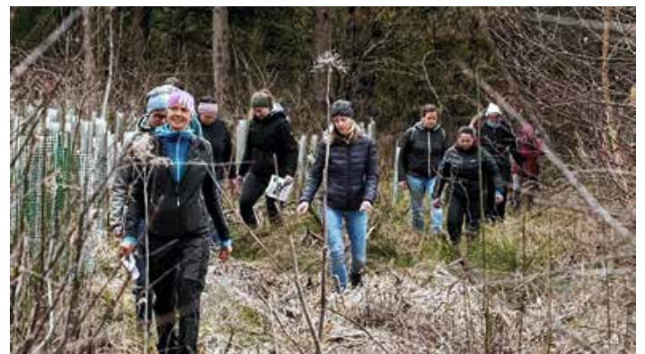
Beim Frauenwaldbegang vermitteln Expertinnen fundiertes Wissen zu waldbaulichen Themen