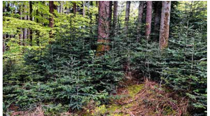
Naturverjüngung im Wald: Tanne, Fichte und Buche wachsen in verschiedenen Entwicklungsstadien nach.

Am Ende geht es um die Zukunft der Wälder im Allgäu. „Wer heute die richtigen Entscheidungen trifft, prägt den Wald für die nächsten 100 bis 150 Jahre“, sagt Östreicher. „Unser Ziel sind stabile und vielfältige Wälder, die den Klimaveränderungen trotzen können.“