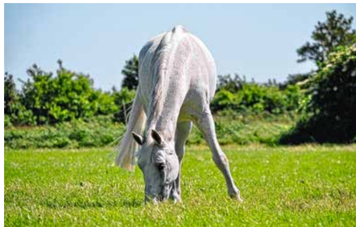
Bildbeschreibung: Gutes Futter beginnt auf der Fläche: Der Grünlandtag Pferd vermittelt praxisnah, wie sich Grünland gezielt verbessern und die Qualität des Pferdefutters sichern lässt.

Weitere Informationen bei Stephan Kulms unter Stephan.Kulms@aelf-ke.bayern.de