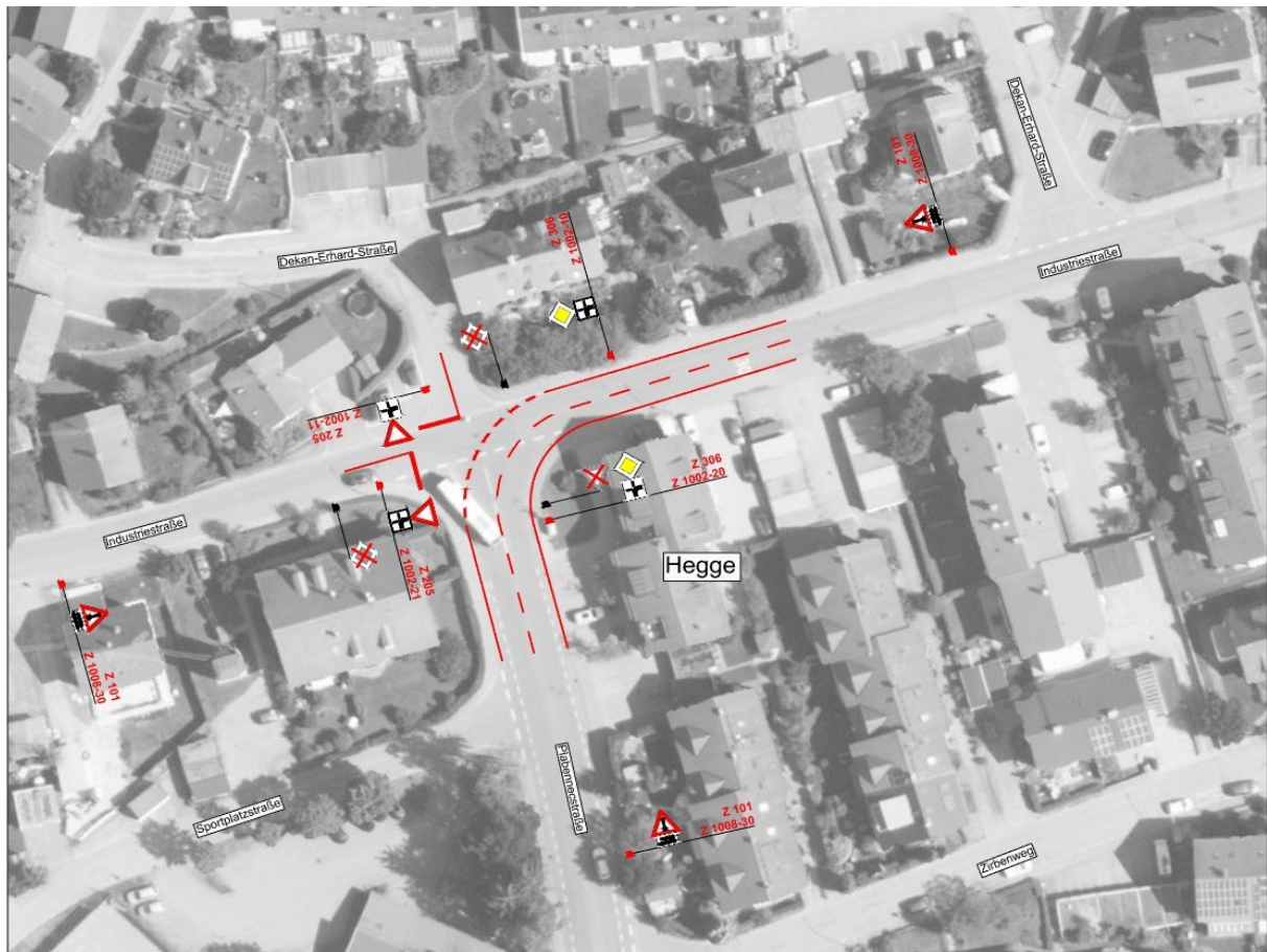
B 19 Bauabschnitt Nord Vorfahrtsänderung Industrie-/Plabennecstraße Hegge ab 15.06.2026