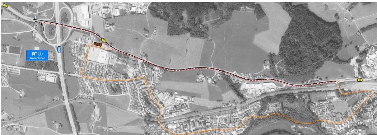
B 19 – Bauabschnitt Nord ab 15.06.2026

Nachts (20:00 bis 06:00 Uhr) ist die B19 ab der Einmündung Industriestraße bis zur Einmündung Obere Eicher Straße voll gesperrt. Die Umleitung erfolgt in beiden Fahrrichtungen über die Buchenberger Straße / Ahornweg / Plabennecstraße / Industriestraße / Nestlestraße / Georg-Haindl-Straße / Heggener Straße / Obere-Eicher-Straße. Schwerverkehr ab 12 Tonnen wird über die Anschlussstelle Durach umgeleitet.