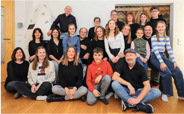
Text und Bild: Christian Meggle