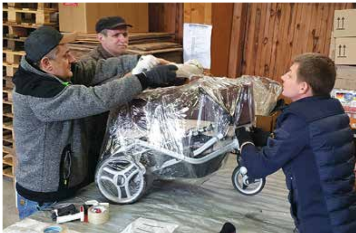
Drei Helfer verpacken einen Kinderwagen.

Öffnungszeiten: samstags von 9 bis 12 Uhr in Sulzberg, Ried 8; Info-Telefon ab 15 Uhr: 0171/9510445