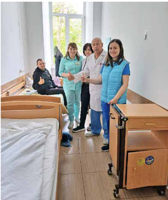
Ukrainische Ärzte, Pfleger und Patienten freuen sich sehr über die Pflegebetten aus dem Allgäu.

dringend benötigt. Die gezielten russischen Angriffe hören nicht auf. Täglich warten schwerstverletzte Patienten in der Notaufnahme der Krankenhäuser auf ihre Erstversorgung. Erwachsene, Kinder, alte Menschen und Soldaten“ sagt Olga. Sie dankt allen Spendern von Herzen für die großartige und anhaltende Spendenbereitschaft aus dem Allgäu. „Es ist gut zu wissen, dass wir nicht allein sind. Das wir nicht vergessen werden.“ Olga fuhr mit ihrem Transporter auch zu einem Pflegeheim in der Nähe. „Wir danken von Herzen für die 12 Rollatoren, die 30 Paar Krücken und die 10 Kartons mit Medikamenten, Verbandsmaterial und Spezialnahrung“ sagt die Leiterin des Pflegeheims. „Diese Spenden aus Deutschland helfen uns sehr, unsere Patienten zu versorgen. Danke an STAND WITH UKRAINE - Unser Allgäu hilft.“