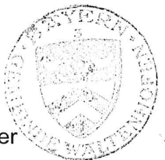
Eckhard Harscher Erster Bürgermeister