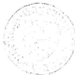
Eckhard Harscher Erster Bürgermeister