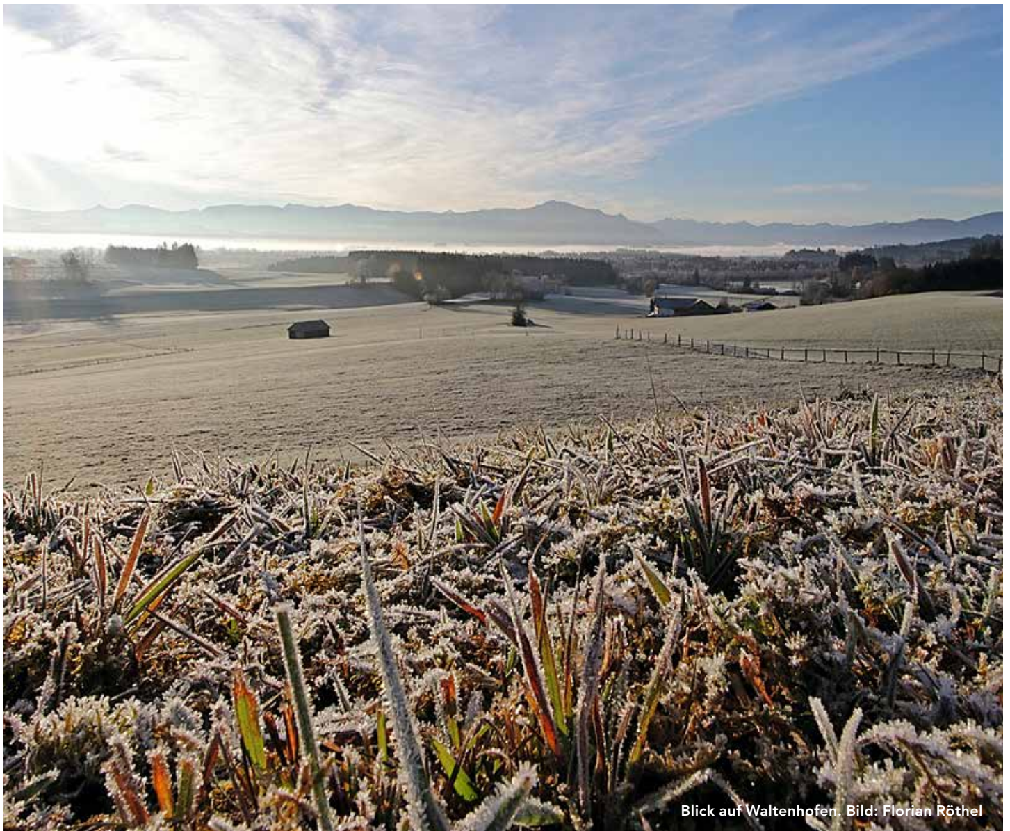
Blick auf Waltenhofen.

Die aktuellen Spielpläne werden auch auf www.waltenhofen-handball.de veröffentlicht.