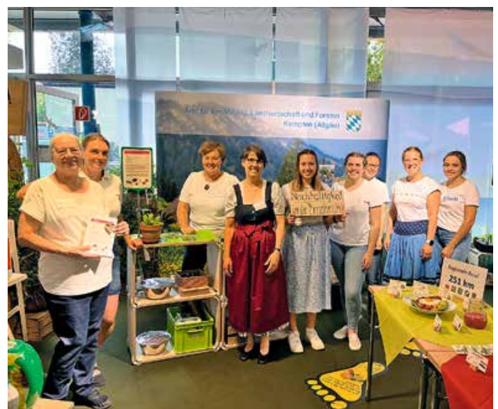
Studierende und Lehrkräfte der Fachschule für Ernährung und Haushaltsführung auf der Festwoche 2023.