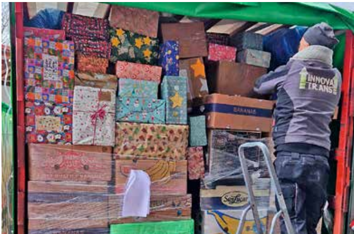
Der Weihnachtstruck wird beladen.

Die Bevölkerung in der Ukraine wird derzeit täglich von russischen Raketen und Drohnen angegriffen. Ziele der russischen Aggression sind zivile Einrichtungen wie Wohn- und Krankenhäuser, Elektrizitätswerke und Einkaufszentren. Die humanitäre Situation ist unerträglich. Wir unterstützen die Menschen in der Ukraine weiterhin. Das gesamte Helferteam ist Ihnen, unseren treuen Spendern, sehr dankbar, dass wir wieder der Ukraine Hilfe leisten konnten. Bitte unterstützen Sie uns weiterhin so großzügig.