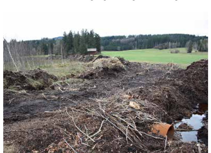
Text und Bild: Franz Summerer

Mit freundlicher Genehmigung der Allgäuer Zeitung