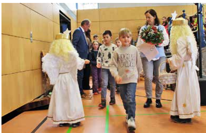
Bilder: Jacquelin Andree