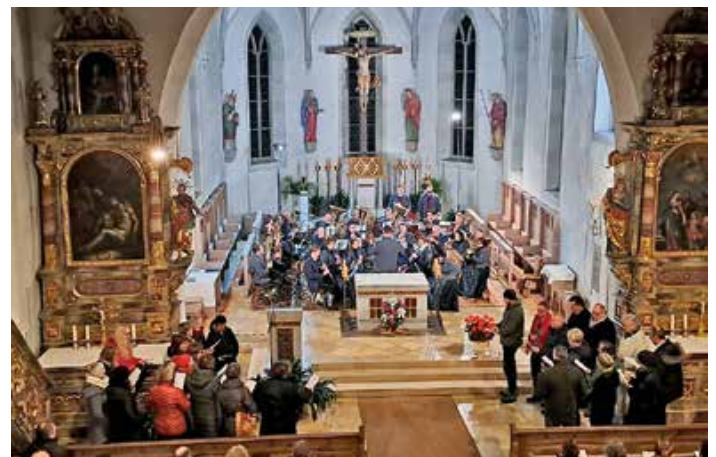
Konzert in der Kirche St. Martin in Martinszell mit dem Musikverein Martinszell und dem Kirchenchor Martinszell