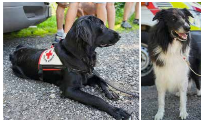
Beim Patentag der Rettungshundestaffel in Waltenhofen war der Andrang groß. Mit dabei die beiden die beiden Rettungshunde Stella und Mailo.

Ihre Ansprechpartnerin für Anzeigenschaltungen im Bürgerbrief Waltenhofen