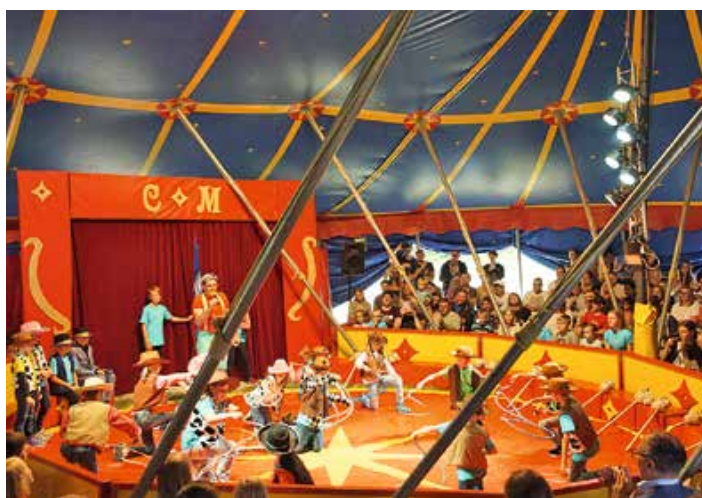
Text: K. Wucher