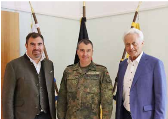
Zu den Teilnehmenden zählten unter anderem die beiden Bundestagsabgeordneten Herr Florian Hahn (links im Bild) und Herr Dr. Peter Ramsauer (rechts im Bild).