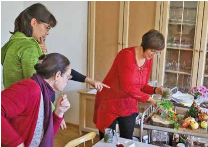
Tischdeko gestalten ist eines der Inhalte der Teilzeitschule Hauswirtschaft, die sich auch an berufliche Quereinsteiger richtet, die lernen wollen, wie man professionell und nach haltig einen Haushalt führt.

Weitere Informationen erhalten Sie unter www.aelf-ke.bayern.de , Tel. 0831/52613-0 bzw. -1211 oder Mail poststelle@aelf-ke.bayern.de