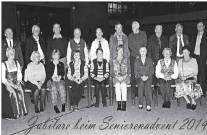
Jubelpaare aus dem Jahr 2014 beim Seniorenadvent Waltenhofen.